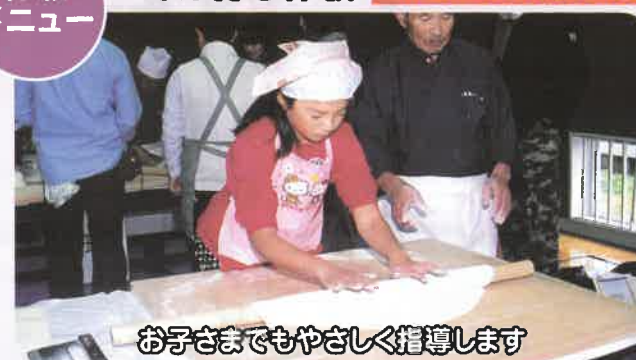
お子さまでもやさしく指導します