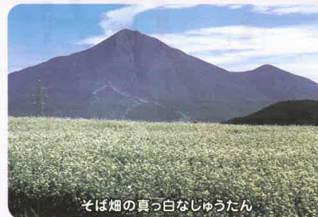
そば畑の真っ白なじゅうたん