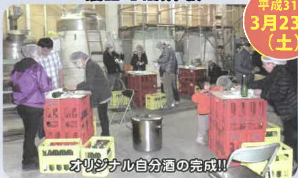
オリジナル自分酒の完成!!

※天候等の理由で内容、日程が変更になる場合があります。あらかじめご了承ください。 ※体験にはご家族、ご友人もご参加いただけます。(参加費別途)