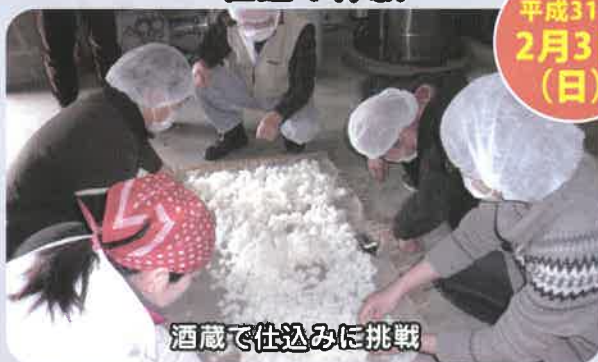
酒蔵で仕込みに挑戦