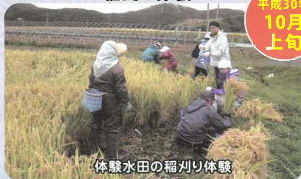
体験水田の稲刈り体験