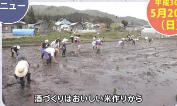
酒づくりはおいしい米作りから