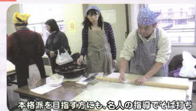
本格派を目指す方にも、名人の指導でそば打ち