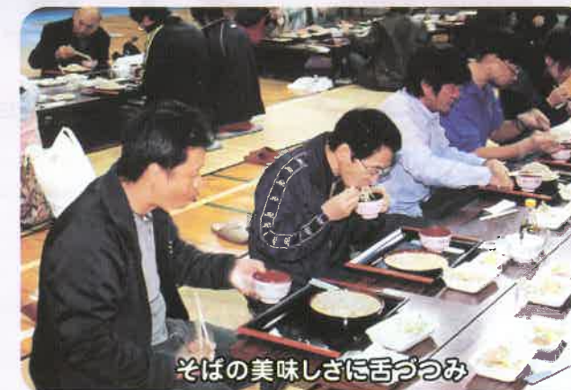
そばの美味しさに舌つつみ